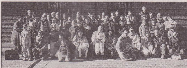
Teilnehmer Belgisch-Deutsches-Karatecamp in Kasterlee

Noch ein Hinweis, am 11.05.2013 fand von 11:00 - 17:00 Uhr in der Turnhalle der Grundschule Mehlingen ein Selbstverteidigungskurs nach Krav Maga Combat System statt.