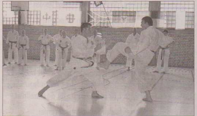
Für die Zukunft ist bereits ein weiterer Besuch in Südafrika, sowie ein Gasshuku in Kanada geplant.